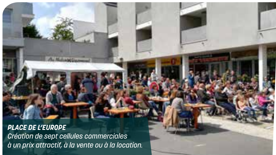
PLACE DE L'EUROPE Création de sept cellules commerciales à un prix attractif, à la vente ou à la location.