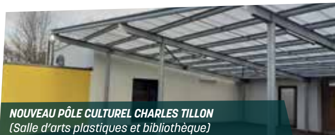
NOUVEAU PÔLE CULTUREL CHARLES TILLON (Salle d'arts plastiques et bibliothèque)

Une nouvelle filière d'enseignement bilingue français/breton est proposée à l'école Charles Tillon. Depuis 2018, des enfants de 3 classes de la maternelle à l'élémentaire, bénéficient d'un enseignement bilingue. Cette filière a pour vocation de se poursuivre au collège puis au lycée.