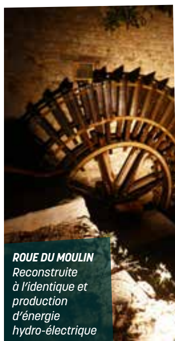
ROUE DU MOULIN Reconstruite à l'identique et production d'énergie hydro-électrique