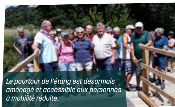
Le pourtour de l'étang est désormais aménagé et accessible aux personnes à mobilité réduite.