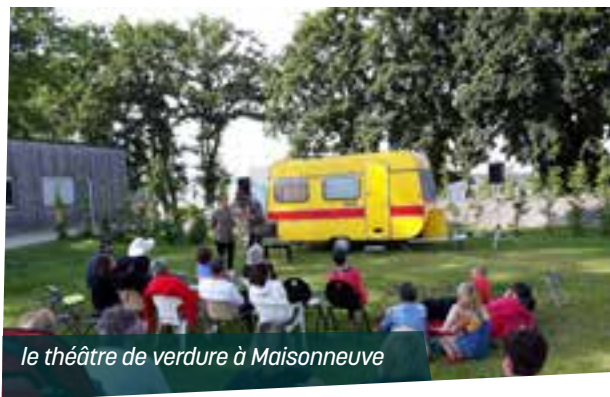
le théâtre de verdure à Maisonneuve

Cette mémoire de la commune se construit et se partage aussi lors des jumelages avec Hambrücken (Allemagne) et Wingrave Angleterre). Le soutien de la commune et le dynamisme de l'association « La Bouëxière Echanges » ont permis de fêter respectivement 25 et 30 ans de découvertes culturelles mutuelles.