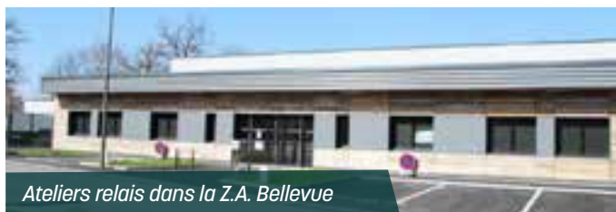
Ateliers relais dans la Z.A. Bellevue

La communauté de communes a aussi contribué avec le département et la région à de nombreux investissements pour environ 2 millions € dans les domaines sportifs (subvention salle de sport), touristiques (Chevré) et économiques (l'atelier relais).