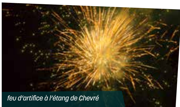
feu d'artifice à l'étang de Chevré