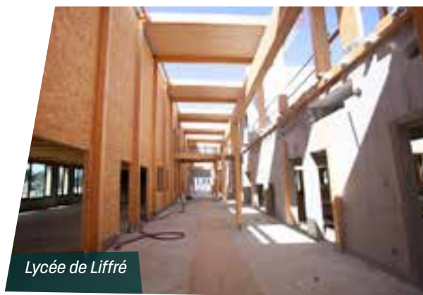
Lycée de Liffré