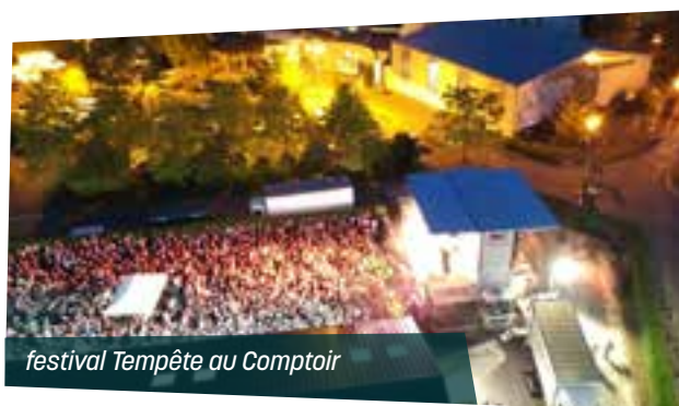
festival Tempête au Comptoir