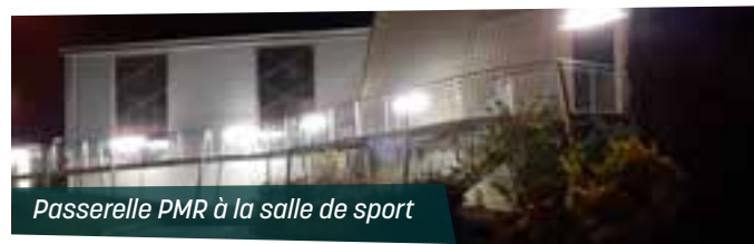
Passerelle PMR à la salle de sport