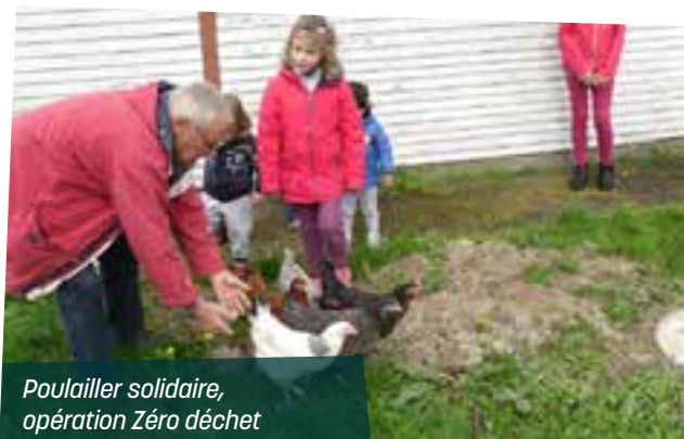
Poulailler solidaire, opération Zéro déchet