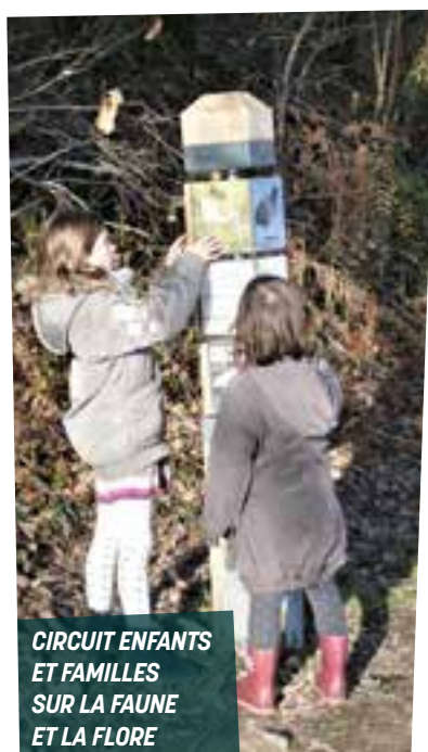
CIRCUIT ENFANTS ET FAMILLES SUR LA FAUNE ET LA FLORE