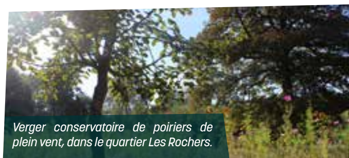
Verger conservatoire de poiriers de plein vent, dans le quartier Les Rochers.