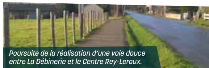
Poursuite de la réalisation d'une voie douce entre La Débinerie et le Centre Rey-Leroux.