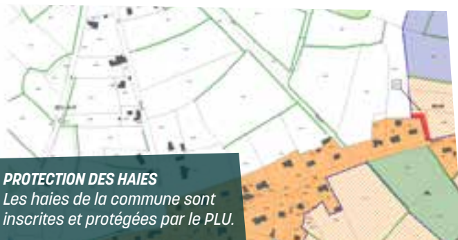
PROTECTION DES HAIES Les haies de la commune sont inscrites et protégées par le PLU.

Enfin, le PLU de 2017 a permis de réduire d'environ 50% la consommation des terres agricoles en imposant une densification des constructions sur les zones d'extension urbaine dans le cœur de bourg.