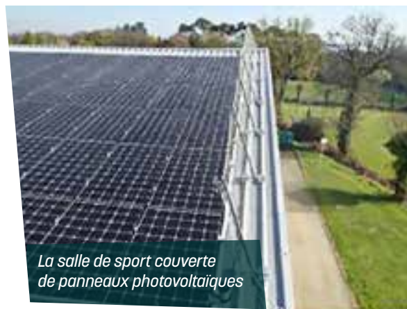
La salle de sport couverte de panneaux photovoltaïques

L'opération Zéro déchet alimentaire à la cantine municipale